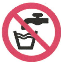
Abbildung 2: Zeichen für „Kein Trinkwasser“

Nichttrinkwasserleitungen sind nach der Trinkwasserverordnung und nach DIN 2403 eindeutig und dauerhaft farblich unterschiedlich zu kennzeichnen, damit es zu keiner Verwechslung kommt. Alle Entnahmestellen der RWNA sind mit einem Schild „Kein Trinkwasser“ oder dem Bild (Abb.2) zu kennzeichnen.